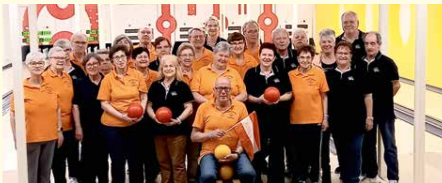
Die Kegelfreunde unseres Pensionistenverbandes gewannen das Turnier in Porec.