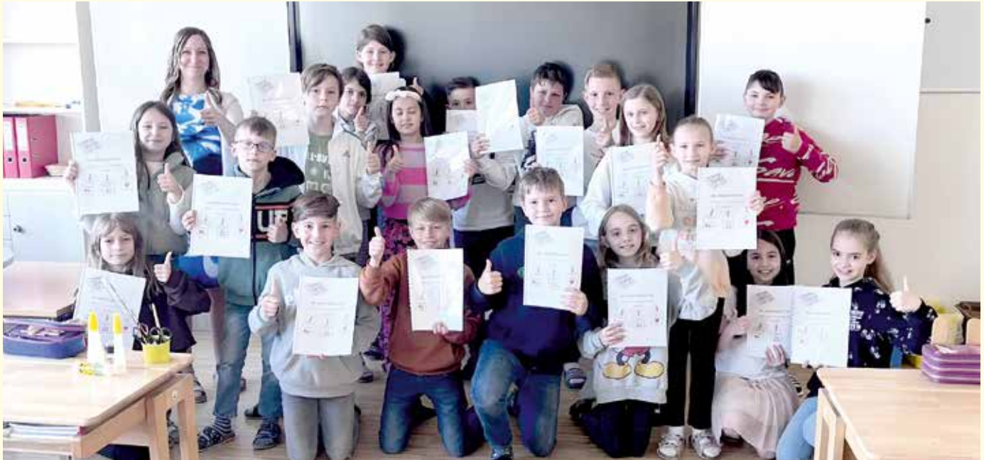
Das Abschlussprojekt der vierten Klasse trägt zur Stärkung der Schreibkompetenzen der Schülerinnen und Schüler bei.