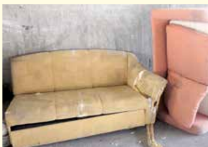
Der anfallende Sperrmüll muss ordnungsgemäß entsorgt werden.

Leider kommt es immer öfter vor, dass Bürgerinnen und Bürger Restmüll, der in die schwarze Tonne gehört, zur Sperrmüllsammlung bringen. Ausschließlich die Größe und nicht die Menge des Abfalls machen den Unterschied zwischen Sperrmüll und Restmüll. Auch fünf volle Restmüllsäcke werden nicht zum Sperrmüll. Die eigene Restmülltonne sollte deshalb auch für den „kleinen“ Müll genützt werden. Sonst bleiben vielleicht Mülltonnen halbleer. Im Gegenzug wird bei der Sperrmüllsammlung aber Restmüll angeliefert. Das sind vor allem Kinderspielzeug, Wasserschläuche, Kehrlicht, Staubsaugerbeutel, Zahnbürsten, Einwegrasierer, Glühbirnen usw. Damit hat das Übernahmepersonal im Altstoff-