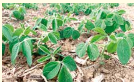
Soja-Mulchsaat auf Maisstroh, ©Koch J.