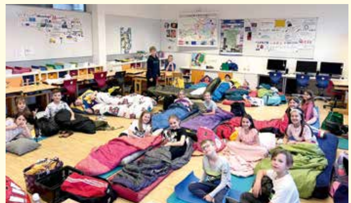
Riesenspaß hatten die Schülerinnen und Schüler der vierten Klasse bei der Lesenacht.