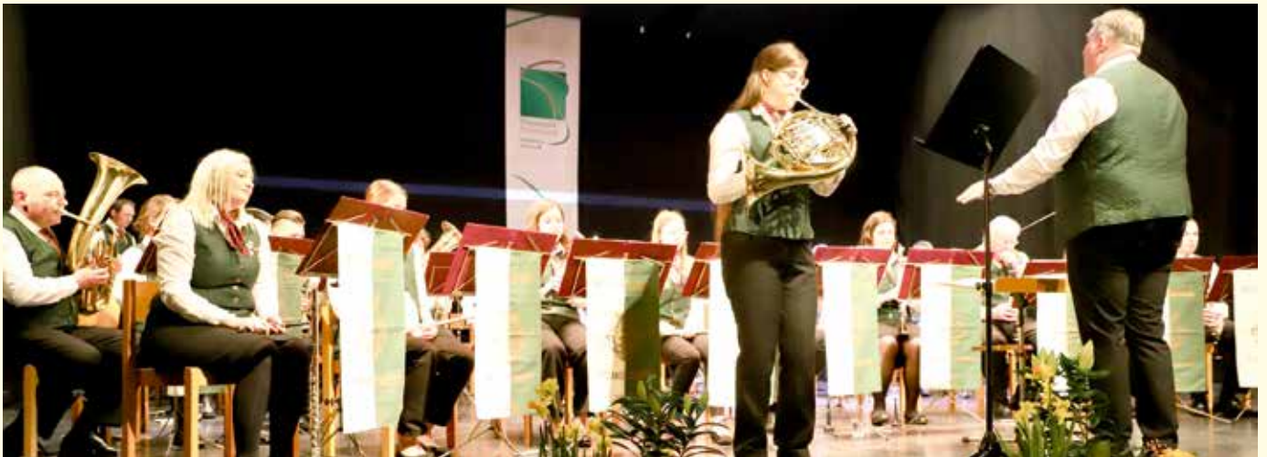
Der Musikverein Schölbing präsentierte nach drei Jahren Coronapause wieder „Blasmusik für Jung und Alt“.