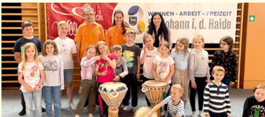
Für große Begeisterung sorgte der Trommelworkshop.