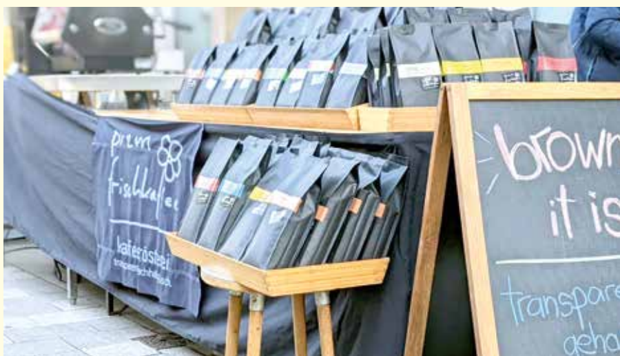
Der „prem frischkaffee“ ist auch auf einem Markt in Wien erhältlich.

ne herausgeholt“, erklärt Prem das Produktionsverfahren.