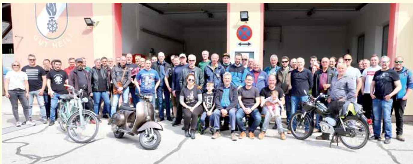
Die Teilnehmerinnen und Teilnehmer an der ersten XXXL-Moped- und Vespaausfahrt in Unterlungitz.

Die Oldtimerfreunde St. Johann luden zur ersten XXXL-Ausfahrt. Zahlreiche Moped- und Vespafahrerinnen und -fahrer präsentierten dabei ihre „Schätze“.