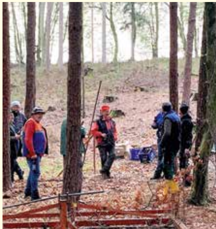
Die fleißigen Helfer bei der Wiederaufforstung.

Nebenbei wurde gemeinsam mit dem Grundnachbarn die Wiederaufforstung eines Teiles des Waldes durchgeführt. Hier war es notwendig einige 100 Laufmeter Zaun neu zu errichten. Auch die 1.000 Bäumchen, welche vom Förster bestimmt wurden, sind bereits gesetzt. Am 1. Mai 2023 wurde die erste Labstelle des Familienwandertages des Heimkehrer-, Sport und Unterstützungsver-