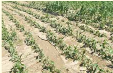
Schäden an Mais und Bodenverschlammung nach einem Erosionsereignis (Mai 2022)

Die Starkregenereignisse des letzten Jahres in der Steiermark zeigen uns einmal mehr, dass wir den Klimawandel sehr ernst nehmen und auch darauf reagieren müssen. Klimamodelle gehen davon aus, dass Starkregenereignisse weiter zunehmen werden. Entsprechend steigt auf landwirtschaftlichen Flächen auch das Risiko für Ertragsverluste durch Erosion oder Verschlammung. Durch massive Erosionen entstehen aber auch immer höhere Kosten im Bereich der Straßen- und Grabeninfrastruktur, verstärkt aber auch an Gebäuden. Gemeinden und Straßenerhalter sind immer weniger bereit diese Kosten zu übernehmen. Konflikte zwischen Landwirten, Bürgern und Gemeinden nehmen in diesem Zusammenhang merklich zu. Mittel- und langfristig ist der Verlust an wertvollem Humus und Boden aber wohl der größte Schaden den wir durch Erosionen erleiden.