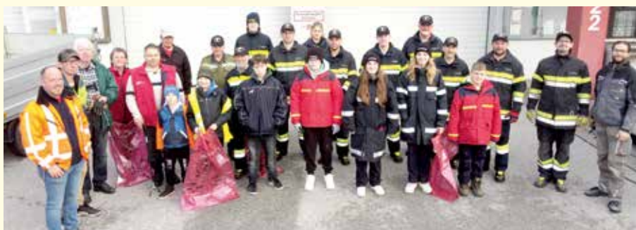
In Schölböng stellten sich die Feuerwehr sowie die Dorfbewohnerinnen und Dorfbewohner in den Dienst der guten Sache.