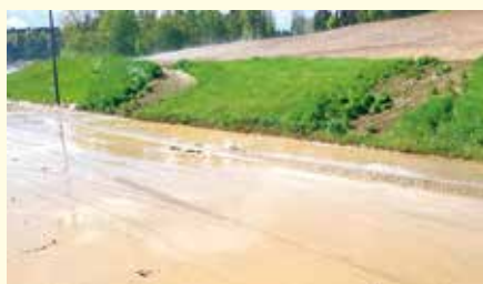
Massive Erosionen und Vermurung nach kurzem Starkniederschlag (© Sundl M., Ende April 2023)