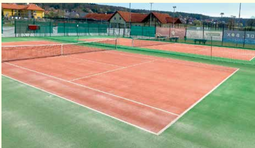
Die beiden Plätze unseres ASKÖ Tennisvereines St. Johann präsentieren sich in bestem Zustand.