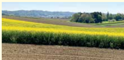
Erosionsschutz durch Schlagteilung und Anbau quer zum Hang mit Mais/Raps, ©Kowald J.

Mulchsaat, Direktsaat, Beisaaten mit Getreide in Mais, der Anbau quer zum Hang oder die Schlagteilung (streifenweiser Anbau von Getreide und Mais quer zum Hang als Beispiel) sind etablierte Erosionsschutzmaßnahmen und erfahren inzwischen bereits eine verstärkte Umsetzung im steirischen Maisbaugebiet. Die Kombination mehrerer Maßnahmen sichert den Erfolg der Erosionsschutzstrategie zusätzlich ab.