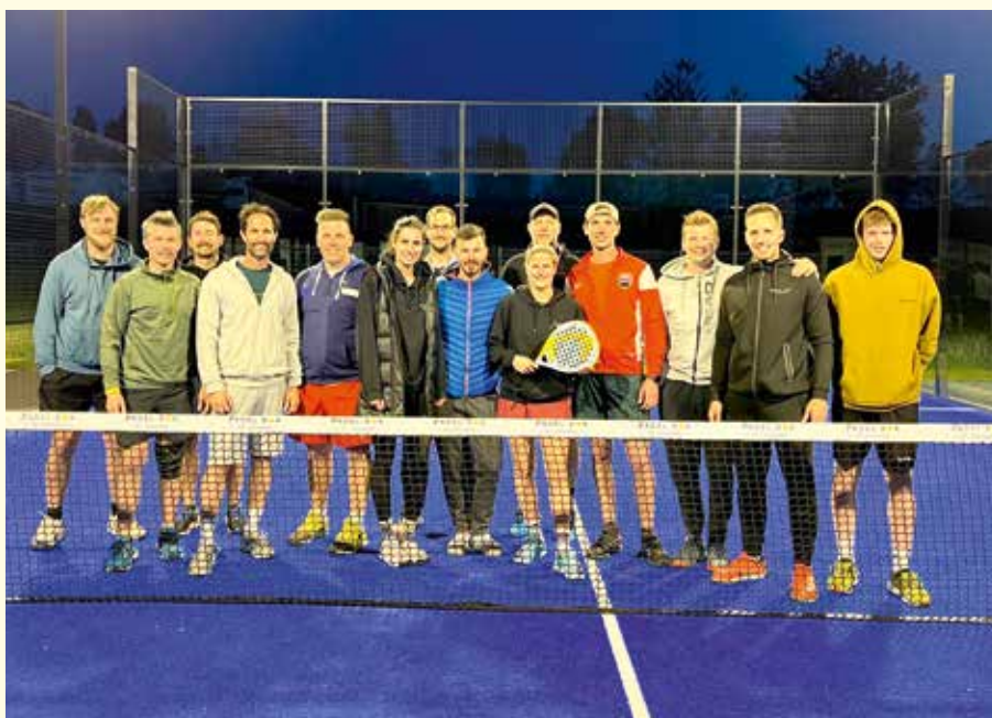
Veranstalter sowie Teilnehmerinnen und Teilnehmer freuen sich über das erfolgreiche Padel-Tennis-Turnier in St. Johann.