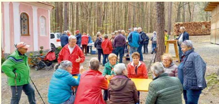
Der Wandertag führte bei herrlichem Wetter zur Loretto Kapelle.

Die Kegelfreunde des Pensionistenverbandes Hartberg und Umgebung nahmen an einem Kegeltour in Porec teil. Unsere Kegelfreunde haben sich mit den besten Keglerinnen und Keglern aus Graz und Umgebung gemessen und das Turnier in der Einzelsowohl wie in der Mannschaftswertung gewonnen. Als krönenden Abschluss gab es am Schiff eine große Siegesfeier. Im Namen der Gemeinde St. Johann ganz herzliche Gratulation an