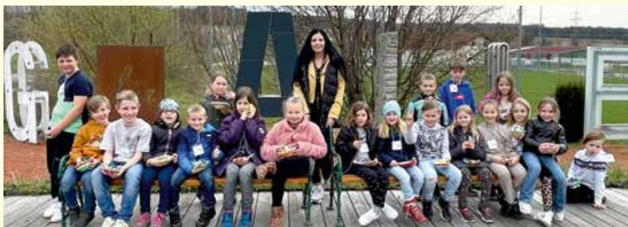
Die Ganztageschule machte einen Ausflug zu unserem ABC Park.