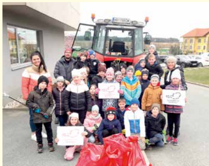
Die Schülerinnen und Schüler der zweiten und dritten Klassen unserer Volksschule waren mit großer Begeisterung bei der Sache.