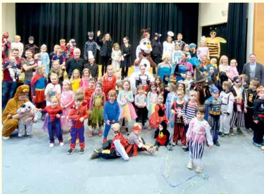
Mehr als 100 verkleidete Kinder waren bei der Kinderfreunde-Faschingsparty.