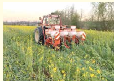
Mais-Direktsaat in winterharte Gründücke, ©Koch J.