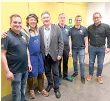
Der Kabarettabend mit „Luis aus Südtirol“ war ein voller Erfolg.

Bei ausverkauftem Hause konnten wir den Darbietungen des Luis aus Südtirol beiwohnen. Es wurde ein lustiger Kabarettabend mit Besucherinnen und Besuchern aus Nah und Fern.