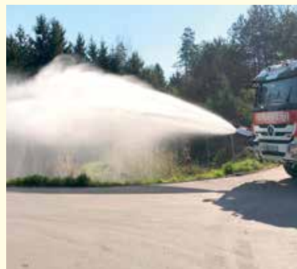
Die FF Unterlungitz stellte bei der KHD-Übung ihr Können unter Beweis.

Ausblick: Am 6. August 2023 findet die traditionelle Grillparty in der Freizeithalle Unterlungitz statt.