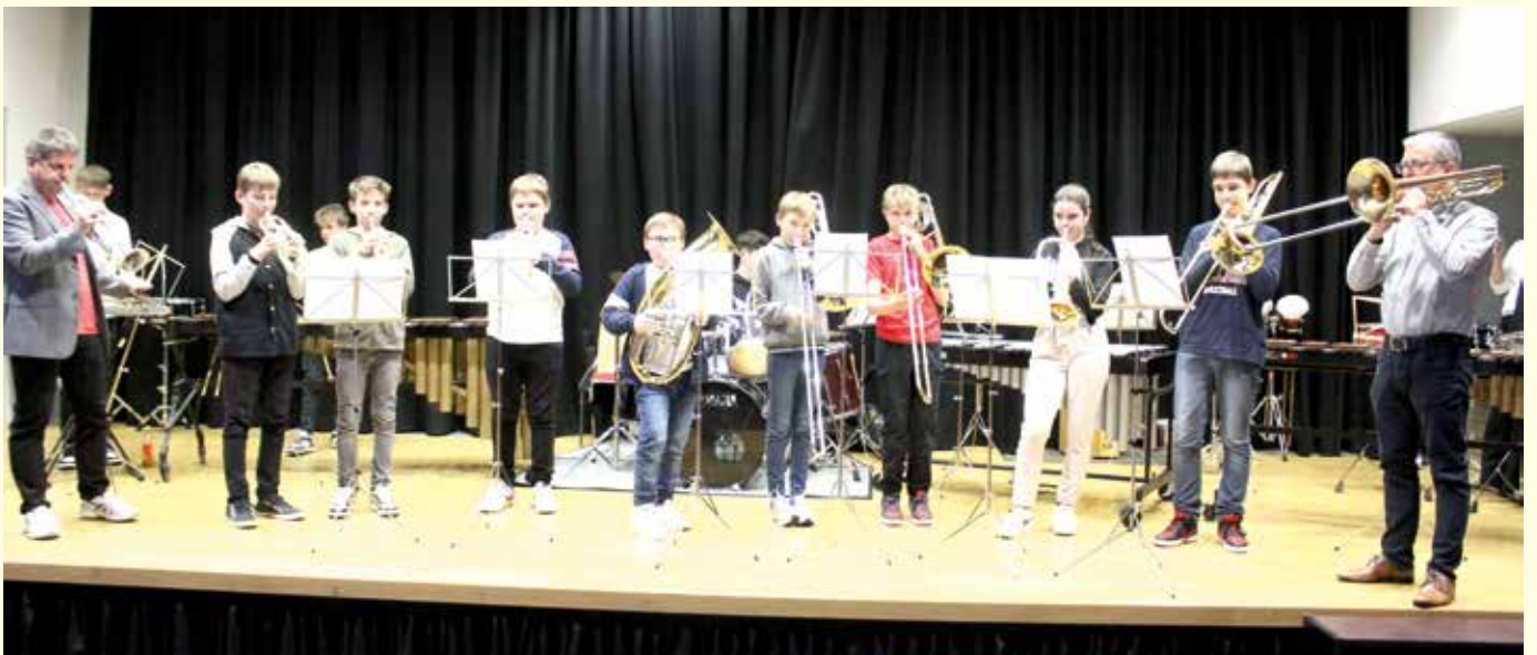
Die Musikschülerinnen und Musikschüler aus unserer Gemeinde stellten beim musischen Abend ihr Talent unter Beweis.

Zahlreiche Nachwuchsmusikerinnen und Nachwuchsmusiker aus unserer Gemeinde stellten anlässlich des musischen Abends in der Raiffeisen Kultur- und Sporthalle der Volksschule St. Johann ihr musikalisches Können unter Beweis.