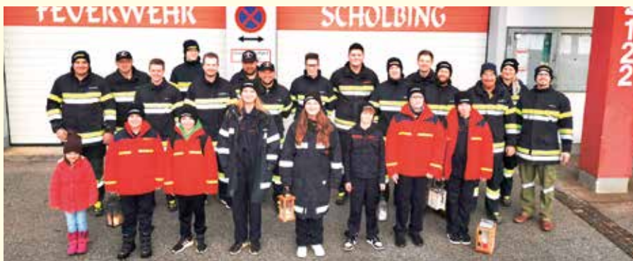
Am 24. Dezember 2022 brachte die Feuerwehrjugend das Friedenslicht in alle Häuser.