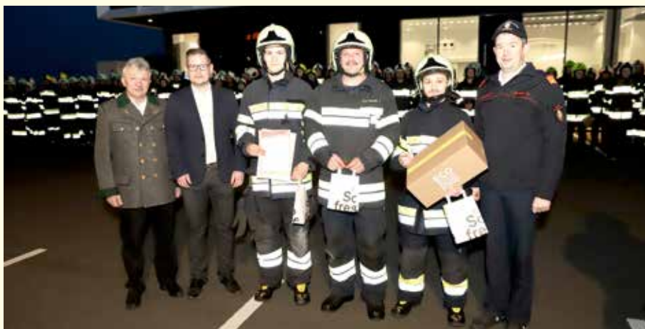
Die Atemschutzträger aus Unterlungitz im Kreis der Gratulanten.