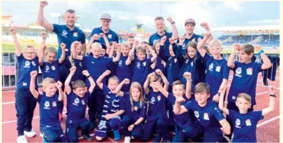
Die Jungkickerinnen und Jungkicker unseres Sportvereins waren als Einlauf- und Ballkinder beim TSV Egger Glas Hartberg aktiv.

Erst kürzlich fungierten unsere Kinder bei einem Bundesligaspiel des TSV Egger Glas Hartberg den Profikickern als Einlauf- und Ballkinder. Die Erinnerung, wenn man mit