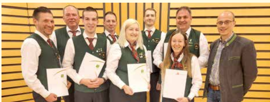
Die geehrten Mitglieder im Kreis der Gratulanten.

„Ohne Fleiß kein Preis“ besagt ein altes Sprichwort – dass dieses auch heute