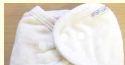
Mehrwegwindeln werden mit 105,- Euro gefördert.

nen die Gemeinde sowie die Umwelt- und Abfallberater des Abfallwirtschaftsverbandes Hartberg unter der Tel. 03332 65456 sehr gerne zur Verfügung.