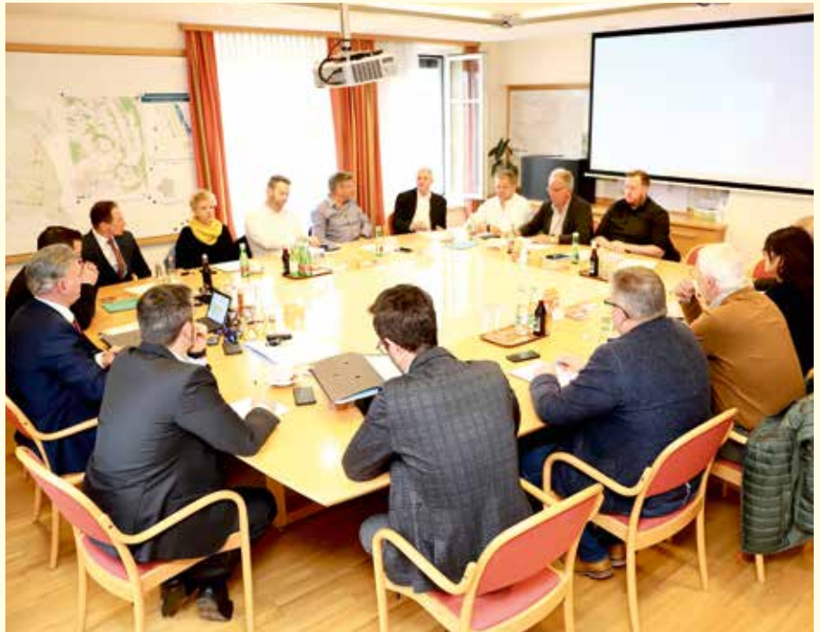
Der Rechnungsabschluss wurde in der Gemeinderatssitzung am 2. April 2023 ausführlich beraten und einstimmig beschlossen.

Erfreulich war die Entwicklung der Ertragsanteile und der Kommunalsteuer im