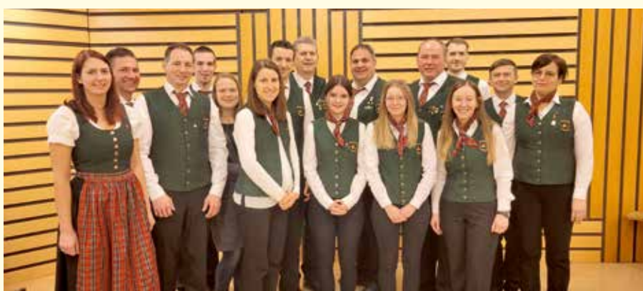
Der neu gewählte Vorstand des Musikvereines Schölböing.