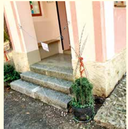
Die Renovierungsarbeiten schritten zügig voran.

Ein weiteres Highlight war die Einweihung der renovierten Kapelle am 18. Juni 2023 samt anschließendem Frühschoppen. Für die musikalische Umrahmung sorgten die Musikvereine St. Magdalena, Schölbling und Unterrohr. Näheres zu dieser Veranstaltung erfahren Sie in der nächsten Ausgabe der Gemeindezeitung.