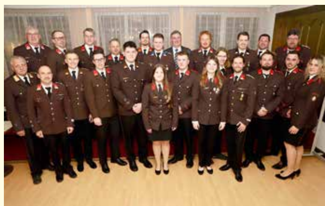
Zahlreiche Kameradinnen und Kameraden wurden für ihren Einsatz mit der Steirischen Katastrophen-Hilfsmedaille in Bronze ausgezeichnet.