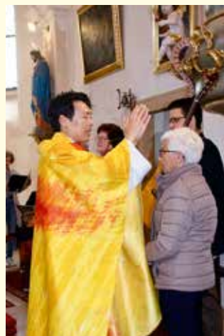
Allen Geburtstagsjubilareinnen und Geburtstagsjubilaren wird der Einzelsegen gespendet.