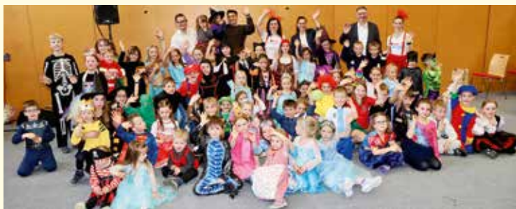
Große Begeisterung herrschte bei der Faschingsparty.