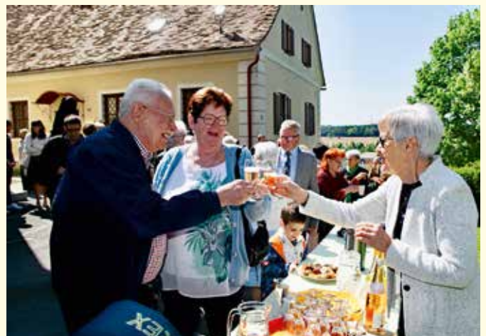
Im Anschluss wird beim Pfarrkaffee mit einem Glas Sekt angestoßen.