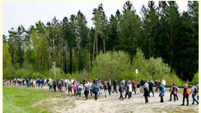
Der Emmausgang vom Bahnhof in St. Johann bis zur Pfarrkirche ist eine beliebte Tradition.

Am dritten oder vierten Sonntag jeden Monats sind alle Kinder, Jugendlichen und Erwachsenen, die in diesem Monat Geburtstag haben, zur Geburtstagsmesse mit Einzelsegen und musikalischem Geburtstagsständchen eingeladen. Im Anschluss wird beim Pfarrkaffee mit einem Glas Sekt angestoßen.