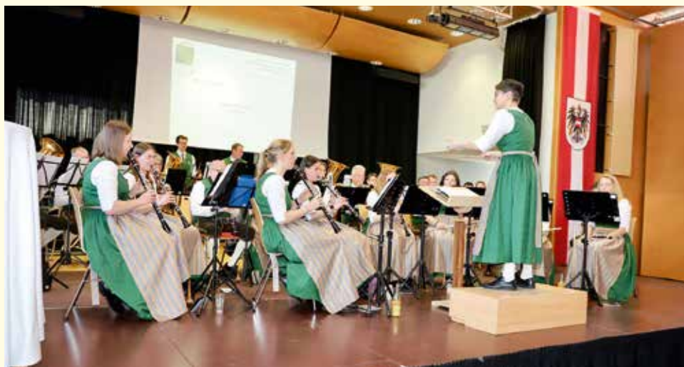
Der Trachtenmusikverein Unterlungitz umrahmte die Generalversammlung musikalisch.