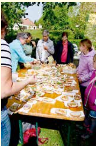
Beim Emmausgang war auch für eine Agape gesorgt.