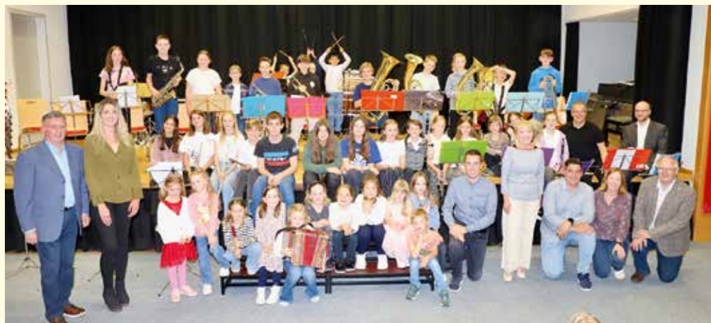
Die Musikschülerinnen und Musikschüler aus unserer Gemeinde stellten beim musischen Abend ihr Talent unter Beweis.