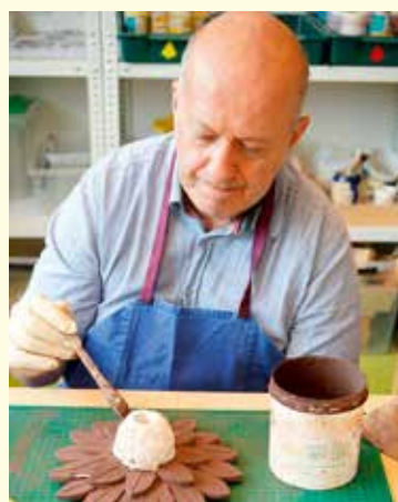
Beschäftigung in der Keramikwerkstatt.

Lebenshilfe Hartberg 8295 St. Johann 249 Tel. 03332 64555 E-Mail: verwaltung@lebenshilfe-hartberg.at Web: www.lebenshilfe-hartberg.at