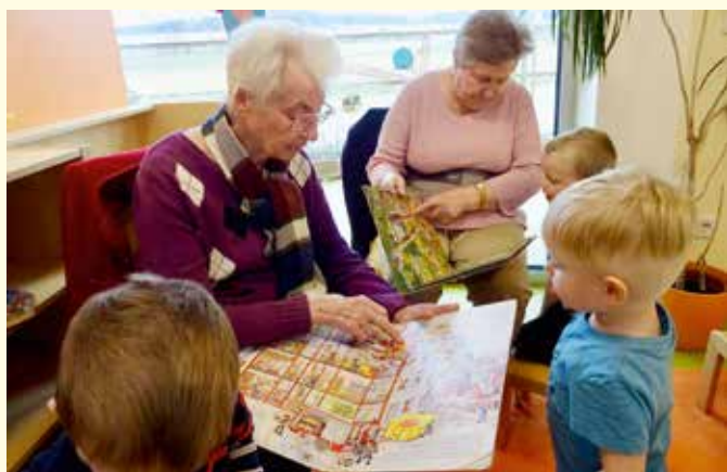
Eine Bewohnerin und ein Bewohner des Seniorenzentrums Föhrenhof lasen den Kindern Bilderbücher vor.

Informationen zur Kinderkrippe finden Sie auf der Homepage der Gemeinde oder telefonisch unter 0676 870841010.