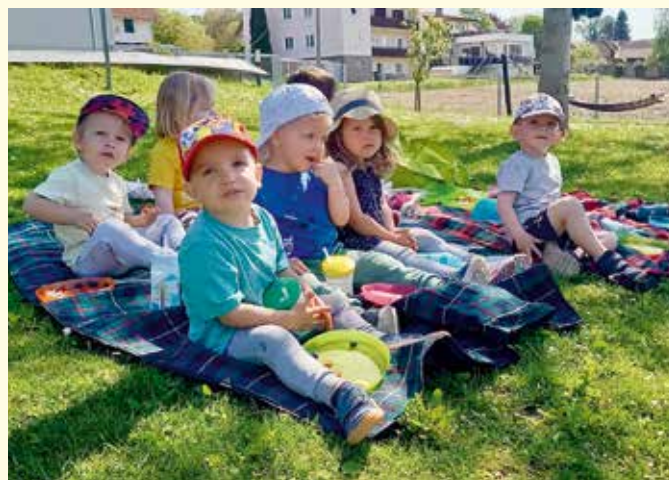
Die Kinder durften gemeinsam mit ihren Eltern ihr Nest im Garten suchen.