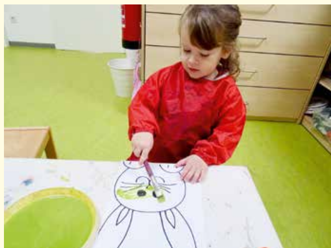
Während der Osterzeit wurde dem Osterhasen unter die Arme ge-griffen.