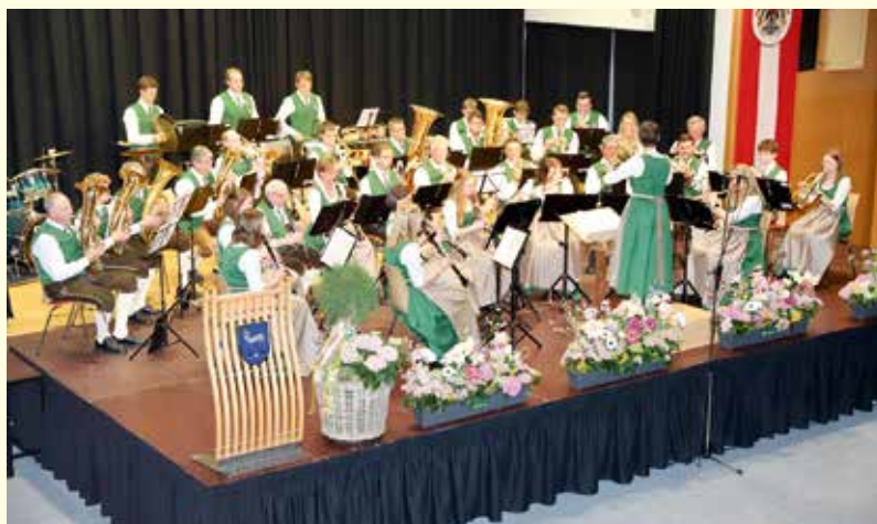
Der Trachtenmusikverein Unterlungitz unterhielt mit einem schwungvollen und abwechslungsreichen Programm.