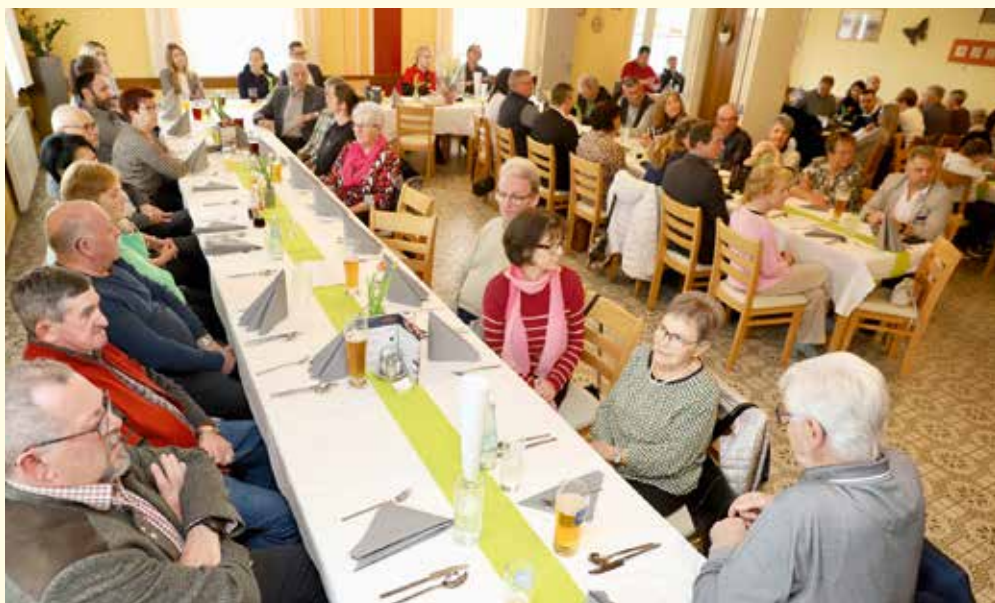
Zahlreiche Persönlichkeiten aus der Gemeinde St. Johann waren zum Rechnungsabschlussessen geladen.