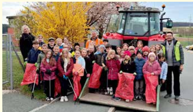
Die Schülerinnen und Schüler der zweiten und dritten Klasse unserer Volksschule waren mit großer Begeisterung bei der Sache.